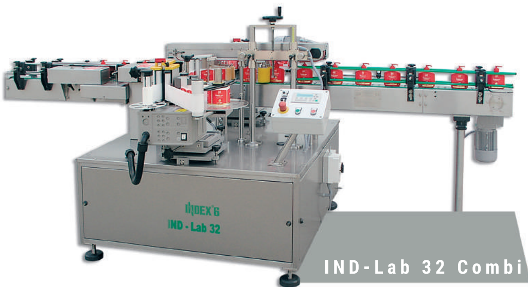
IND-Lab 32 Combi

Машины для наклеивания двух этикеток на две противоположные стороны плоской и овальной упаковки или для наклеивания одной круговой этикетки на цилиндрическую упаковку.