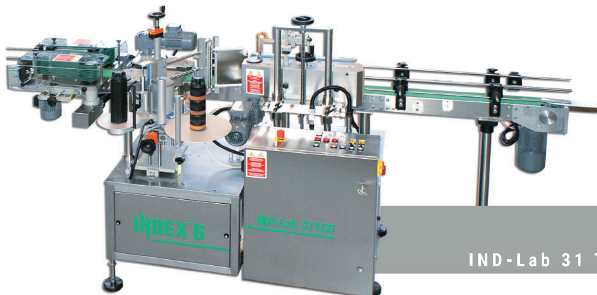
IND - Lab 31 TCG